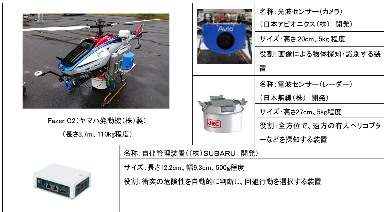
図1 中型の無人航空機と衝突回避システム構成機器